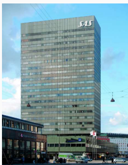
SAS Royal Hotel på hjørnet af Vesterbrogade og Hammerichsgade i København.

Og hvordan han forsøgte at hente den omkringliggende natur helt ind i folks stuer, i mødelokaler, kantiner og trappeforløb ved hjælp af vinterhaver, glasfacader og farvesætning af vægge og tekstiler og dermed skabte en organisk overgang mellem ude og inde.