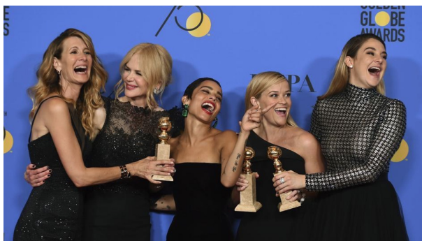
FOTO FRA GOLDEN GLOBES.

Serien vandt fire Golden Globes her forleden - og det var oveni alle de andre priser , serien har vundet. Det var de medvirkende ret glade for, som man ser her: