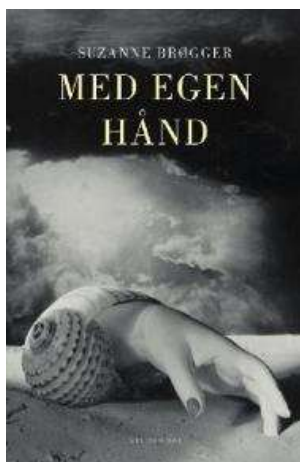
(/boeger/med-egen-haand) MED EGEN HÅND (/BOEGER/MED-EGEN-HAAND) Af Suzanne Brøgger