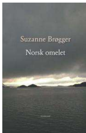
(/boeger/norsk-omelet) NORSK OMELET (/BOEGER/NORSK-OMELET) Af Suzanne Brøgger