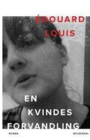
(/boeger/en-kvindes-forvandling) EN KVINDES FORVANDLING (/BOEGER/EN- KVINDES-FORVANDLING) Af Édouard Louis