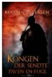
KONGEN DER SENDTE PAVEN EN FUGL

( http://www.historie-online.dk/boger/anmeldelser-5-5/romaner/kobenhavn-fem-fortaellinger )