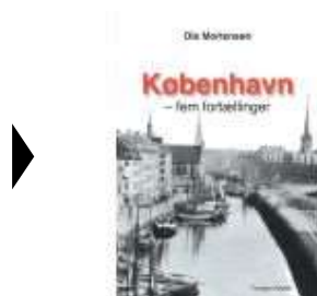
KØBENHAVN - FEM FORTÆLLINGER

( http://www.historie-online.dk/boger/anmeldelser-5-5/romaner/kobenhavn-fem-fortaellinger )