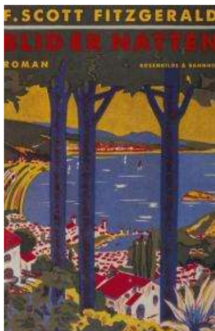
(/boeger/blid-er-natten) BLID ER NATTEN (/BOEGER/BLID-ER-NATTEN) Af F. Scott Fitzgerald