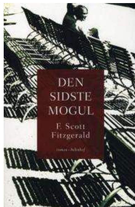
(/boeger/den-sidste-mogul) DEN SIDSTE MOGUL (/BOEGER/DEN-SIDSTE-MOGUL) Af F. Scott Fitzgerald