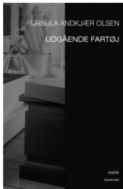
(/boeger/udgaende-fartoj) UDGÅENDE FARTØJ (/BOEGER/UDGAENDE-FARTOJ) Af Ursula Andkjær Olsen