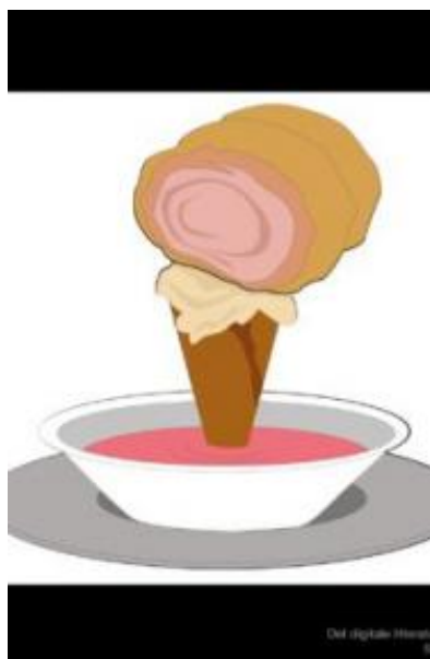
(/boeger/kaos-0) KAOS (/BOEGER/KAOS-0) Af Ursula Andkjær Olsen