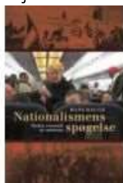
NATIONALISMENS SPØGELSE - MELLEM ROMANTIK OG OPLØSNING

( http://www.historie-online.dk/temaer-9/dansk-vestindien/per-nielsen-fru-jensen-og-andre-vestindiske-danskere-dansk-vestindiske-soemaend-tjenestefolk-og-arbejdere-i-danmark-1880-1920 )