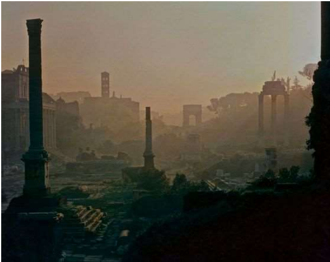
Forum Romanum en tidlig morgen.