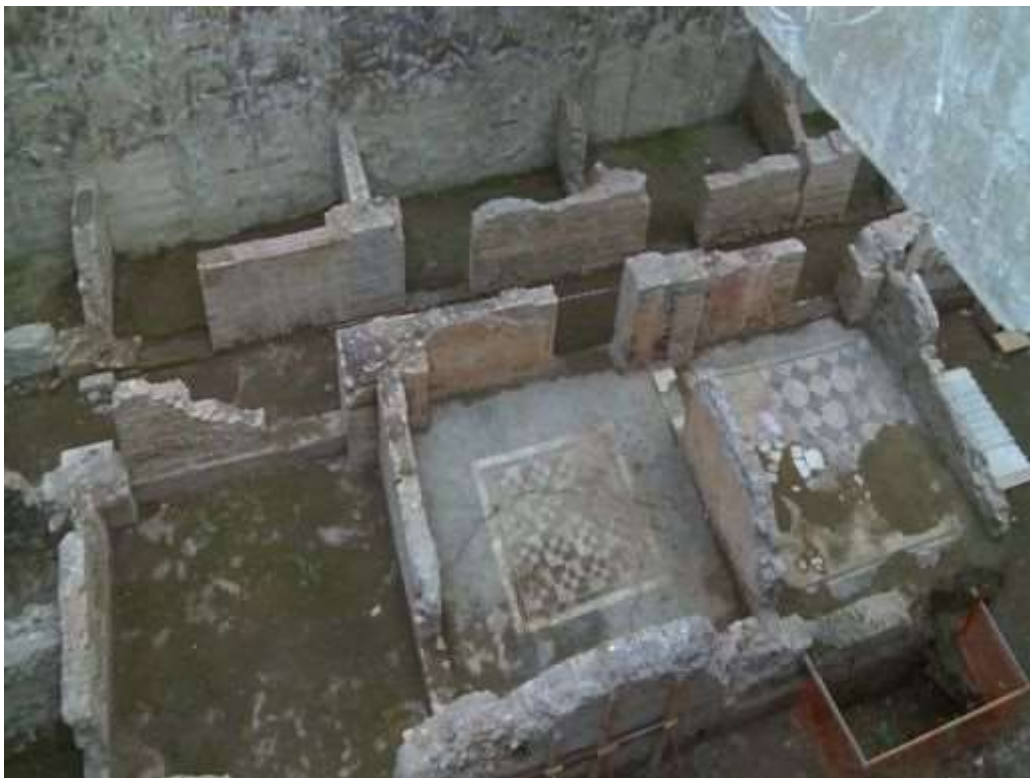
Man fandt næsten et pompeiansk hus da man gravede ud.