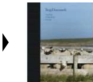
TRAP DANMARK 14: VARDE, ESBJERG, FANØ

( http://www.historie-online.dk/boger/anmeldelser-5-5/historie-og-topografi-11-11-11/trap-danmark-14-varde-esbjerg-fano )