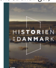
HISTORIEN OM DANMARK

( http://www.historie-online.dk/boger/anmeldelser-5-5/historie-og-topografi-11-11-11/danske-strandinger )