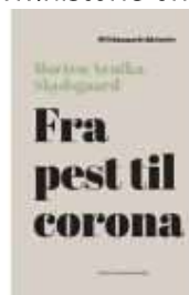
FRA PEST TIL CORONA

( http://www.historie-online.dk/boger/personalhistorisk-tidsskrift-20082 )