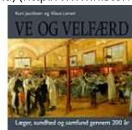
VE OG VELFÆRD

( http://www.historie-online.dk/boger/anmeldelser-5-5/sundhed-sygdom/fra-pest-til-corona )