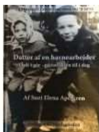
DATTER AF EN HAVNEARBEJDER

( https://www.historie-online.dk/boger/datter-af-en-havnearbejder )