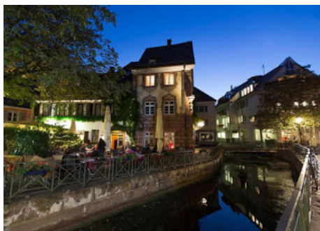
Et hus i Freiburg im Breisgau

Selve skriveprocessen var for mig den mindst krævende del af arbejdet. Hver gang jeg traf en forkert beslutning og skrev mig ind i en blindgyde, så slettede jeg