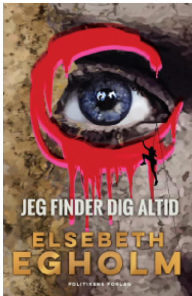
(/boeger/jeg-finder-dig-altid) JEG FINDER DIG ALTID (/BOEGER/JEG-FINDER-DIG-ALTID) Af Elsebeth Egholm