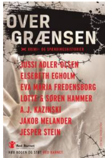
(/boeger/over-graensen-krimi-og-spaendingshistorier) OVER GRÆNSEN, KRIMI-OG SPÆNDINGSHISTORIER (/BOEGER/OVER-GRAENSEN-KRIMI-OG-SPAENDINGSHISTORIER) Af diverse forfattere