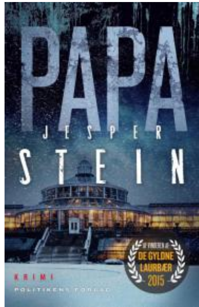
(/boeger/papa) PAPA (/BOEGER/PAPA) Af Jesper Stein