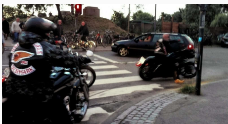
Hells Angels i aktion i København.