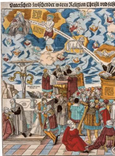
Træsnit af Lucas Cranach den yngre fra 1546.

Bogen dækker selve reformationstiden, enevælden og pietismen i 1700-tallet. Sidste kapitel bevæger sig op i 1800-tallet. Den lutherske ortodoksi fra slutningen af 1500-tallet til midten af 1600-tallet behandles meget sporadisk. Det sammen gælder oplysningstiden, hvor det nærmest forudsættes, at pietismens forestillinger er sammenfaldende med oplysningstidens.