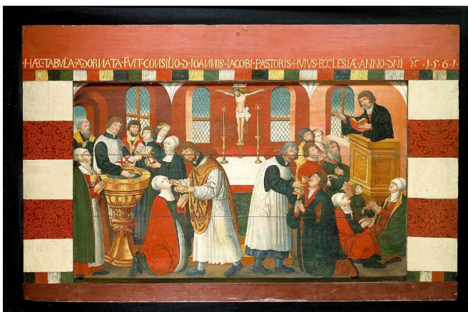
Alterbordsforside fra Torslunde Kirke på Sjælland. Ukendt kunstner 1561.