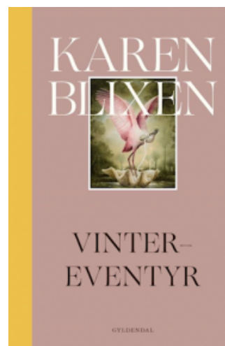
(/boeger/vinter-eventyr) VINTER-EVENTYR (/BOEGER/VINTER-EVENTYR) Af Karen Blixen