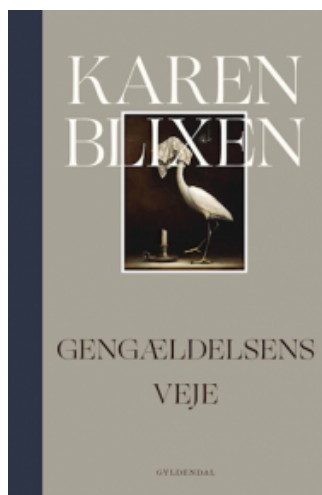
(/boeger/gengaeldelsens-veje) GENGÆLDELSENS VEJE (/BOEGER/GENGAELDELSENS-VEJE) Af Karen Blixen