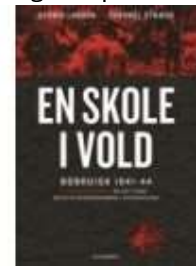
▶ EN SKOLE I VOLD - BOBRUISK 1941-44

( https://www.historie-online.dk/boger/anmeldelser-5-5/dristige-missioner-fra-2-verdenskrig )