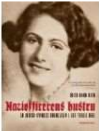
▶ NAZIOFFICERENS HUSTRU

( https://www.historie-online.dk/boger/anmeldelser-5-5/2-verdenskrig-61-61/naziofficerens-hustru )