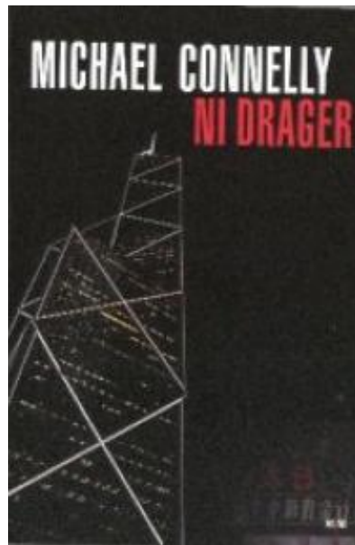
(/boeger/drager-damer-daemoner) DRAGER, DAMER & DÆMONER (/BOEGER/DRAGER- DAMER-DAEMONER) Af Mathias F. Clasen