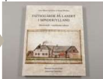
FATTIGGÅRDE PÅ LANDET I SØNDERJYLLAND.

( http://www.historie-online.dk/boger/anmeldelser-5-5/biografier-