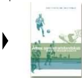
ÅRHUS SOM IDRÆTSLANDSKAB

( http://www.historie-online.dk/boger/de-forbudte-billeder )