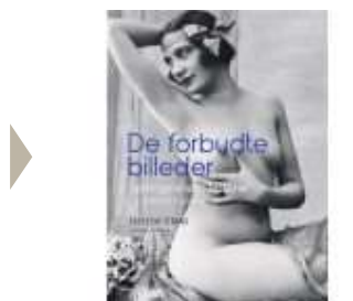
DE FORBUDTE BILLEDER

( http://www.historie-online.dk/boger/de-forbudte-billeder )