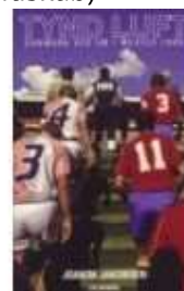
TYND LUFT - DANMARK VED VM I MEXICO 1986

( http://www.historie-online.dk/boger/anmeldelser-5-5/sport-idraet-krop-sundhed-sygdom/aarhus-som-idraetslandskab )