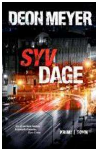
(/boeger/syv-dage) SYV DAGE (/BOEGER/SYV-DAGE) Af Deon Meyer