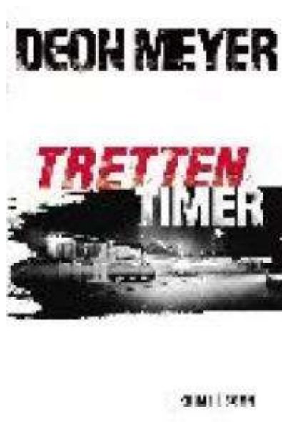
(/boeger/tretten-timer) TRETTEEN TIMER (/BOEGER/TRETTEEN-TIMER) Af Deon Meyer