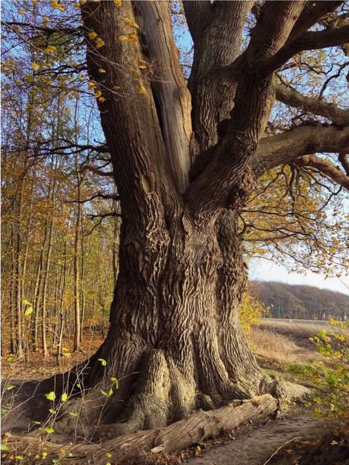
Fra Bogen. Valdemarsegen ved Korselitze er Danmarks største levende egetræ

Respekten og ærefrygten for skoven og de majestætiske egetræer deler jeg nemlig også selv som en arv fra barndommen.