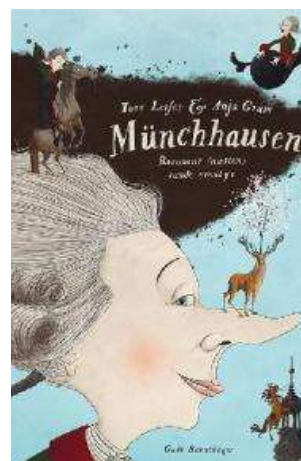
(/boeger/munchhausen-baronens-naesten-sande-eventyr) MÜNCHHAUSEN : BARONENS (NÆSTEN) SANDE EVENTYR (/BOEGER/MUNCHHAUSEN-BARONENS-NAESTEN-SANDE-EVENTYR) Af Tore Leifer