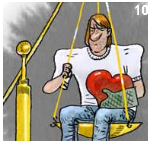
ILLUSTRATION: GITTE SKOV