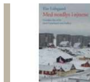
MED NORDLYS I ØJNENE - GENSKIN FRA ET LIV MED GRØNLAND