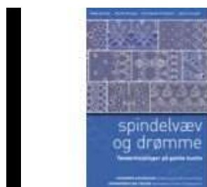
SPINDELVÆV OG DRØMME