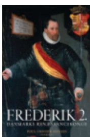
FREDERIK 2. – DANMARKS RENÆSSANCEKONGE

( http://www.historie-online.dk/boger/anmeldelser-5-5/royal-historie-adel-og-borger-landbrug-handvaerk-industri/frederik-2-danmarks-renaessancekong )