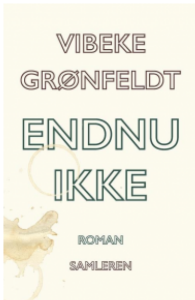
(/boeger/endnu-ikke) ENDNU IKKE (/BOEGER/ENDNU-IKKE) Af Vibeke Grønfeldt