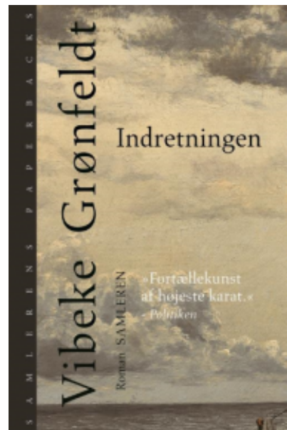
(/boeger/indretningen) INDRETNINGEN (/BOEGER/INDRETNINGEN) Af Vibeke Grønfeldt