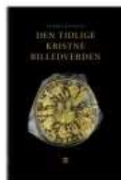
DEN TIDLIGE KRISTNE BILLEDVERDEN

( http://www.historie-online.dk/boger/kunstmaleren-og-prinsessen )