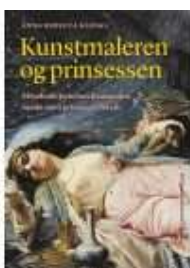
KUNSTMALEREN OG PRINSESSEN

( http://www.historie-online.dk/boger/kunstmaleren-og-prinsessen )