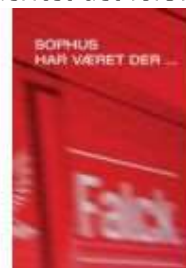
SOFUS HAR VÆRET HER

( http://www.historie-online.dk/boger/anmeldelser-5-5/trafik-og-transport-videnskab-teknik/vaerftet-det-forsvandt )