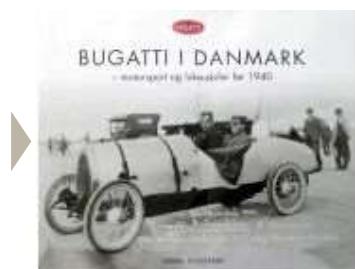
BUGATTI I DANMARK

( http://www.historie-online.dk/boger/bugatti-i-danmark )