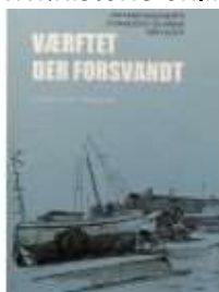
VÆRFTET DER FORSVANDT

( http://www.historie-online.dk/boger/bugatti-i-danmark )