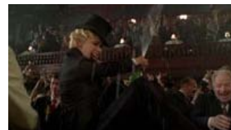
Fig. 9: Forbuddet mod alkohol fejres med en flaske champagne, for forbud er lig med gode forretninger og masser af glade dage.