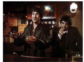
Fig. 15-16: I sin tematik om tilblivelsen af en organiseret, kriminel underverden kan Boardwalk Empire ses som en forhistorie til Scorsese-værker som Mean Streets og GoodFellas .