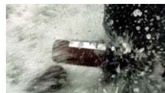
Fig. 7: Titelsekvensen bliver mere dystert, musikken intensiveres, og whiskyflasker smadres mod bolværket.