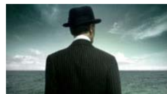
Fig. 5: En elegant klædt mand træder frem på stranden. Til at begynde med må vi nøjes med at se ham bagfra.

Indimellem drages Enoch af et mere ærligt hverdagsliv kropsliggjort af hans fascination - eller forelskelse - i den bundsolide irske immigrant Margaret Schroeder. Enochs splittelse italesættes af hans unge håndlanger James "Jimmy" Darmody i slutningen af det Scorsese-instruerede første afsnit, hvor Jimmy proklamerer "you can't be half a gangster". Denne splittelse vil givetvis være et tilbagevendende tema i serien. Samme James "Jimmy" Darmody er en arketypisk figur i gangstergenren: den fattige mands dragen mod det krimimelle miljø, som han ser som sin eneste vej ud af fattigdommen - og dermed ganske fint indrammes af de Bruce Springsteen-strofer, der indleder denne anmeldelse. Darmody har givetvis påbegyndt sin kriminelle løbebane ved at udføre 'a little favor' for Enoch.