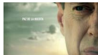
Fig. 6: Snart lærer vi, at vi har at gøre med Steve Buscemi.