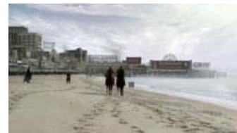
Fig. 20: CGI skæmmer flere steder det ellers vellykkede production design . Det er som om, seriens dragen mod perfektion enkelte steder arbejder sig selv imod og bliver mere facade end substans.