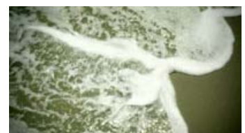
Fig. 4: Vand skyller ind over stranden i den enkle men uhyre stemningsmættede intro til Boardwalk Empire .