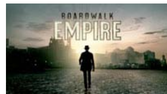
Fig. 8: Seriens logo træder frem, idet Steve Buscemis karakter går målbevidst ind mod den amerikanske kystby Atlantic City.