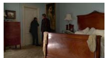
Fig. 19: De lidt komiske besværligheder - eksempelvis ved at bryde en dør ind - er med til at give serien et realistisk udtryk, der også nedbryder den stedvist lidt for