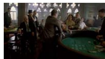
Fig. 10: Enoch ser primært sig selv som politiker, men når sagen kræver det, står han ikke i vejen for at uddele lidt øretæver.