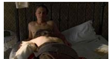
Fig. 17: Ordet 'blowjob' er endnu ikke kommet ind i det amerikanske vokabular i 1920'erne, men derfor kan handlingen jo godt udføres.