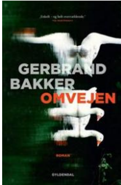
(/boeger/omvejen-0) OMVEJEN (/BOEGER/OMVEJEN-0) Af Gerbrand Bakker