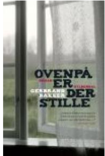
(/boeger/ovenpa-er-der-stille) OVENPÅ ER DER STILLE (/BOEGER/OVENPA-ER-DER-STILLE) Af Gerbrand Bakker