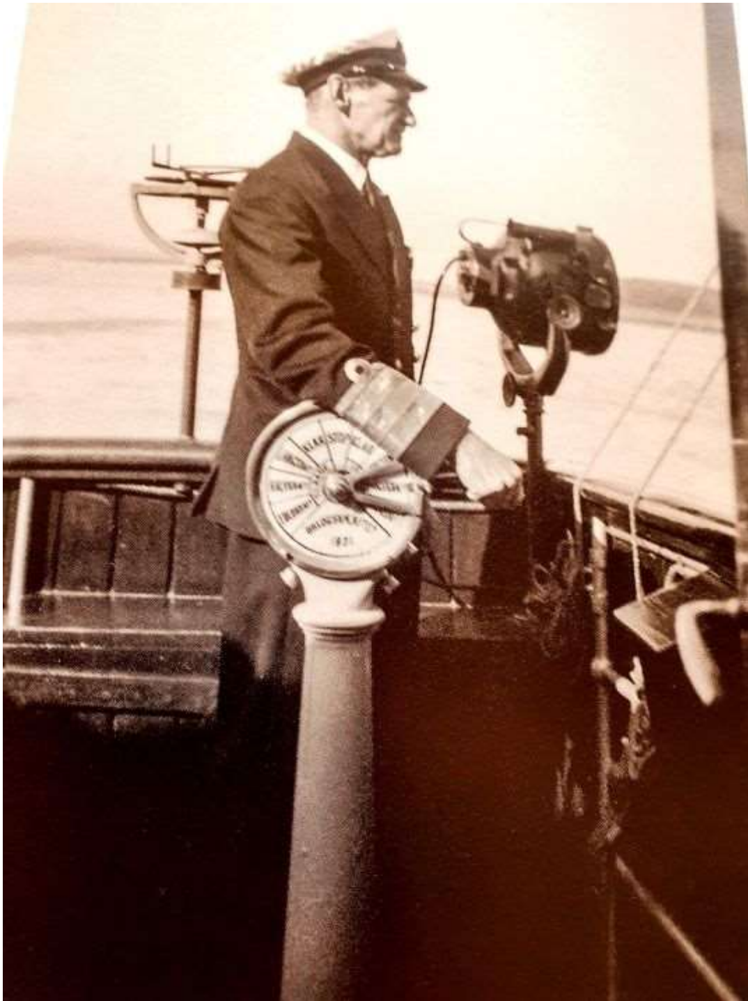
Kong Frederik ved maskintelegrafen. Illustration fra bogen

Nu kan man jo så mene, at "Frederik i flåden" er det, tyskerne kalder en Kleinigkeit. Men der er nu engang noget befriende ved, at dygtige historikere som de tre forfattere vælger at dele ud af deres store viden – uden det nødvendigvis skal være grundforskning. Vores fælles historie myldrer af småfortællinger, små brikker i det kalejdoskop der netop tegner vores fortid.