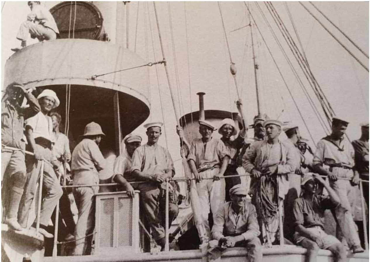
Kronprins Frederik var med til at hente sønderjyske krigsfanger hjem til afstemningen i 1920. Det må have været gribende for dem, hvis de så kronprinsen sammen med Christian IX ride over den gamle grænse i 1920. (Illustration fra bogen).