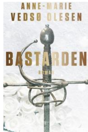
(/boeger/bastarden-0) BASTARDEN (/BOEGER/BASTARDEN-0) Af Anne-Marie Vedsø Olesen