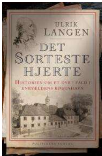
(/boeger/det-sorteste-hjerter) DET SORTESTE HJERTE (/BOEGER/DET-SORTESTE- HJERTE) Af Ulrik Langen