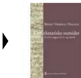
DEN EKSTATISKE OUTSIDER

( http://www.historie-online.dk/boger/anmeldelser-5-5/musik-teater/den-ekstatisk-outsider )