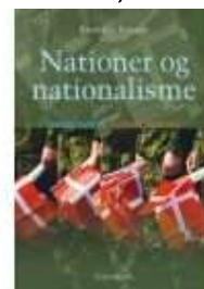
NATIONER OG NATIONALISME

( http://www.historie-online.dk/boger/anmeldelser-5-5/danmark-og-europa-efter-1945/cuba-krisen )