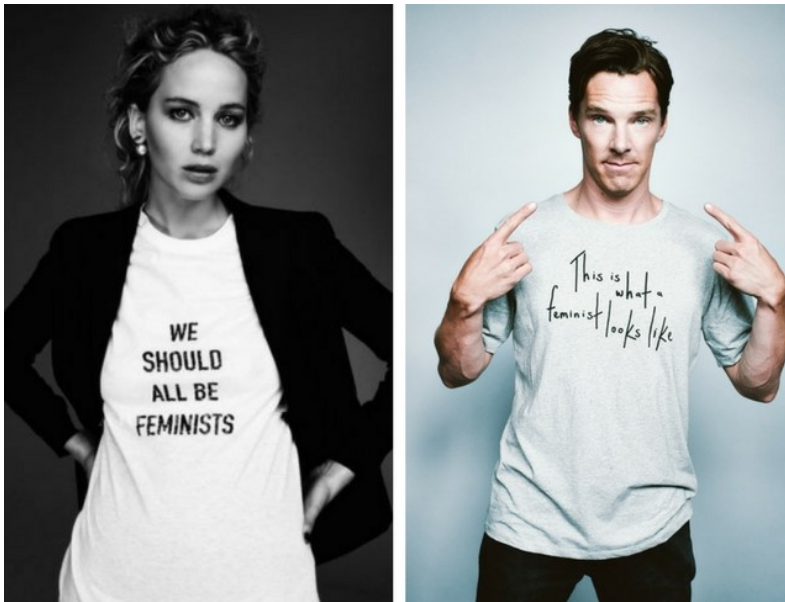
Skuespillerne Jennifer Lawrence og Benedict Cumberbatch bærer statement t-shirts fra henholdsvis Dior og ELLE Magazine.