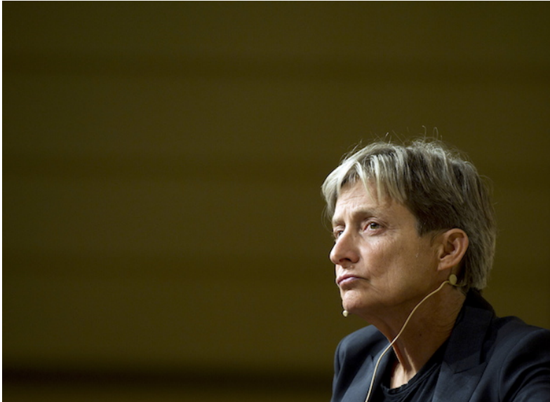
Kønsforsker, filosof og feminist Judith Butler er forfatteren bag "Gender Trouble – Feminism and the Subversion of Identity."

Når kvinder som Girlsquad – og os andre – aktivt overdriver, underdriver eller på anden måde fremstiller kønnet gennem en særlig prisme, gør de betragteren opmærksom på, at kønnet netop er performativt. Eller sagt på en anden måde: Ved at overgøre sin kvindelighed bruger man patriarkatets regler mod patriarkatet selv.