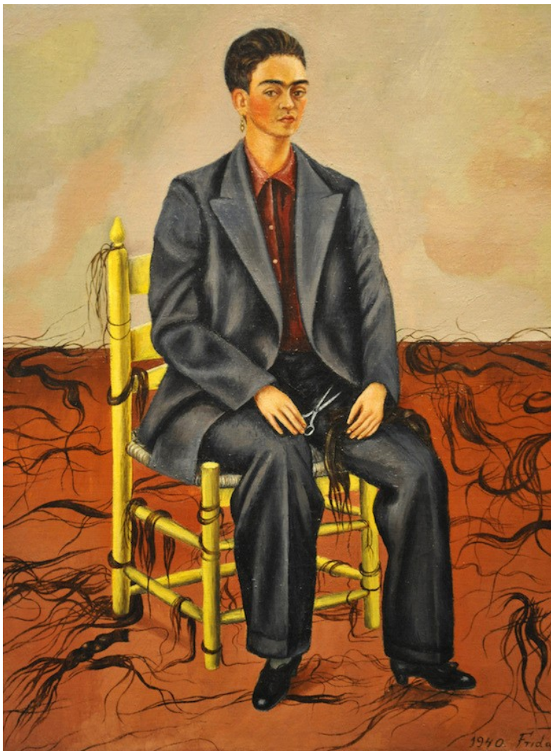
Frida Kahlos 'Self-portrait with cropped hair'.

Denne dobbelthed savner man i Girlsquads æstetik.