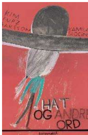
(/boeger/hat-og-andre-ord) HAT OG ANDRE ORD (/BOEGER/HAT-OG-ANDRE-ORD) Af Kim Fupz Aakeson og Kamila Slocinska (III.)