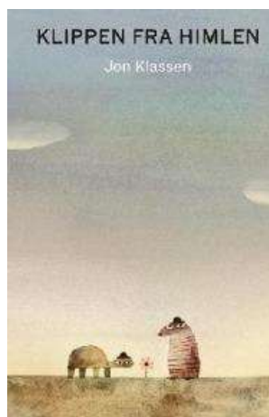
(/boeger/klippen-fra-himlen) KLIPPEN FRA HIMLEN (/BOEGER/KLIPPEN-FRA-HIMLEN) Af Jon Klassen