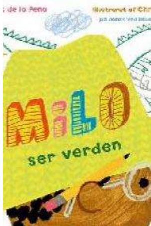
(/boeger/milo-ser-verden) MILO SER VERDEN (/BOEGER/MILO-SER-VERDEN) Af Matt De la Peña