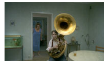
Fig. 2: Et øjebliksbillede og portræt af et ægteskab.