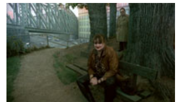
Fig. 6: Der synges og klages i Du Levende : "Der er ingen, der forstår mig!"