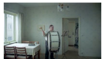
Fig. 8: I takt til marchmusik fra radioen slås der på stortromme: Kærligheden er gensidig: Stortrommen elsker også ham.