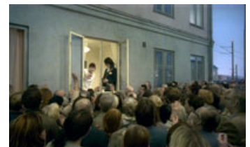
Fig. 5.: Du Levende er fyldt med skrøbelige og utopiske længsler.