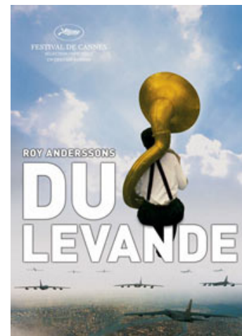
Fig. 1: Roy Anderssons prisbelønnede Du Levende er nu ude på DVD. Scanbox Entertainment har indtil videre kun udgivet den i Sverige, men i en udgave der har såvel norske som engelske undertekster.