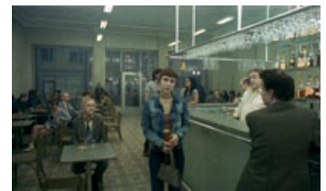
Fig. 4.: Personernes direkte tale til kameraet udstiller filmens bevidste illusionsbrud.