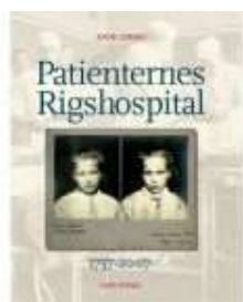
PATIENTERNES RIGSHOSPITAL 1757-2007

( http://www.historie-online.dk/boger/anmeldelser-5-5/sundhed-sygdom/patienternes-rigshospital-1757-2007 )