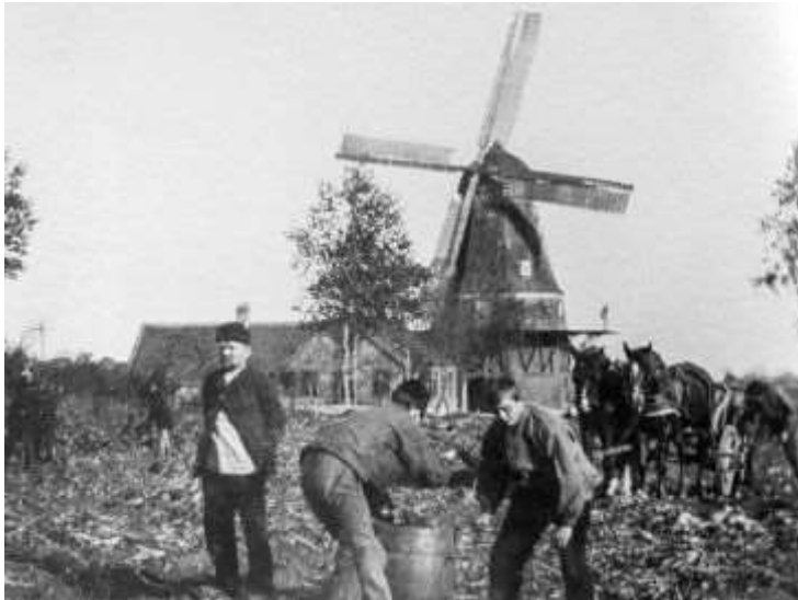
Markarbejde. Illustration fra bogen

Den slags minder dukker frem, når Poul Duedahls pen tegner billedet så stærkt. Han formår virkelig at finde klangbunden hos læserne.