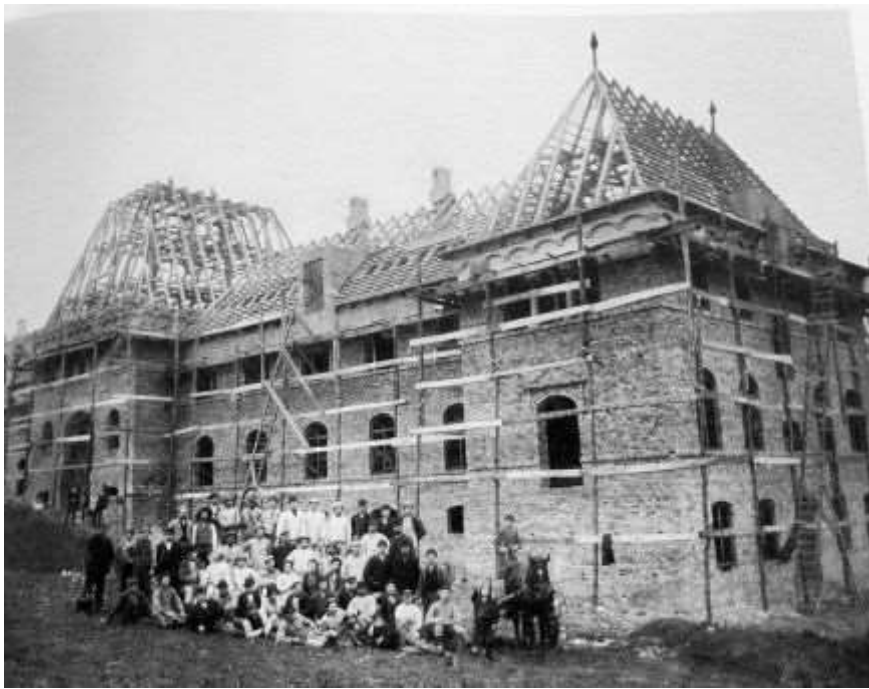
Mandshjemmet i Brejning under opførelse 1899. Billede fra bogen.