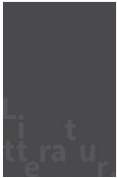
(/boeger/lejrskolen) LEJRSKOLEN (/BOEGER/LEJRSKOLEN) Af Emmanuel Carrère