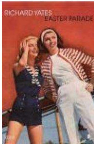
(/boeger/easter-parade) EASTER PARADE (/BOEGER/EASTER-PARADE) Af Richard Yates