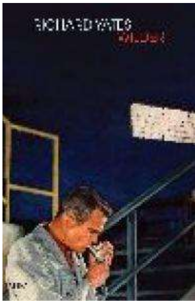
(/boeger/wilder) WILDER (/BOEGER/WILDER) Af Richard Yates