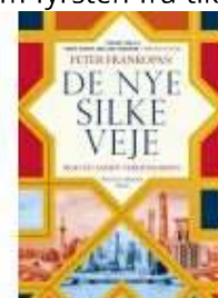
DE NYE SILKEVEJE

( http://www.historie-online.dk/boger/anmeldelser-5-5/biografier-erindringer-60-60/sadam-fyrsten-fra-tikrit )