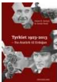
TYRKIET 1923-2013 – FRA ATATÜRK TIL ERDOGAN

( http://www.historie-online.dk/boger/anmeldelser-5-5/oversoeisk/bogfeature-tyrkiet-1923-2013-fra-atatuerk-til-erdogan )