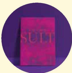
Sult af Tine Høeg