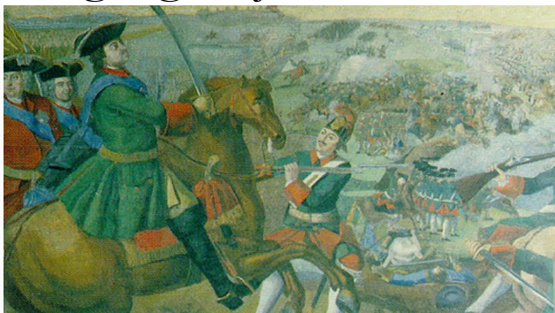
Slaget ved Poltova i Ukraine i 1709.

Området er i dag igen en krigszone som følge af Ruslands invasion af Ukraine. Udsnit af mosaik af Serge Lachinov.