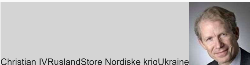
Christian IV Rusland Store Nordiske krig Ukraine

300 års efter denne lange krigs afslutning, trækker Store Nordiske Krig stadig sine spor, og krig og ufred er lige skræmmende, og krig bør stadig forebygges og undgås. Det er den vigtigste politiske opgave. Her kræves stabile og troværdige alliancer, hånd i hånd med et troværdigt forsvar. Bogen viser nødvendigheden af begge dele.