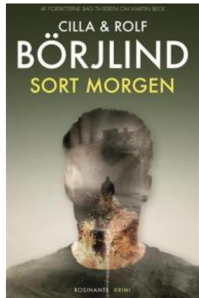
(/boeger/sort-morgen) SORT MORGEN (/BOEGER/SORT-MORGEN) Af Cilla Börjlind og Rolf Börjlind