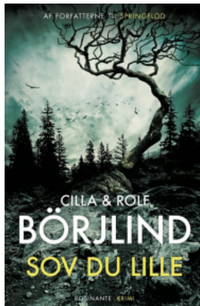
(/boeger/sov-du-lille) SOV DU LILLE (/BOEGER/SOV-DU-LILLE) Af Rolf Börjlind