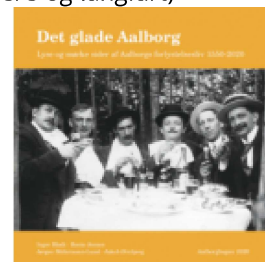
DET GLADE AALBORG

( https://www.historie-online.dk/boger/anmeldelser-5-5/lokal-og-slaegtshistorie/smugleri-skipperer-og-langfart )