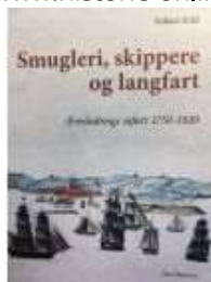
SMUGLERI, SKIPPERE OG LANGFART

( https://www.historie-online.dk/boger/anmeldelser-5-5/vesterlandets-konge-christen-de-linde )