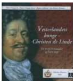
VESTERLANDETS KONGE - CHRISTEN DE LINDE

( https://www.historie-online.dk/boger/anmeldelser-5-5/vesterlandets-konge-christen-de-linde )