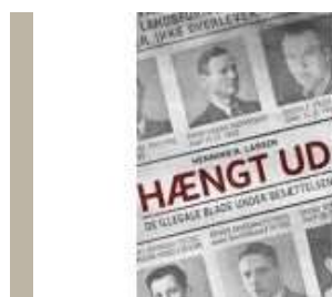
DE ILLEGALE NYHEDER