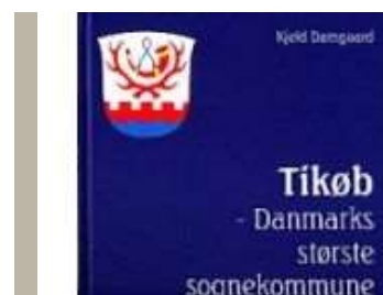
TIKØB - DANMARKS STØRSTE SOGNEKommune