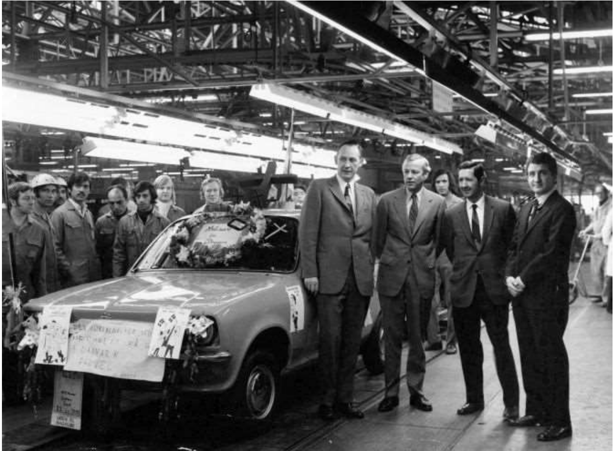
Tæppefald efter 55 år. Sidste bil en Opel Kadett forlader General Motors fabrikken 18. oktober 1974