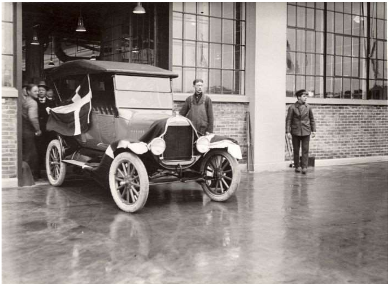
Bileventyret er i gang. Første dansksamlede Ford T ruller ud fra samlebandet 15. november 1924